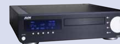
CD-Receiver AVM inspiration C6m