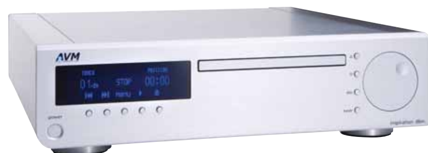
Receptor-DVD AVM inspiration D6m

Diseñado, desarrollado y fabricado en Alemania