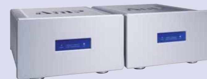
Amplificadores mono AMP

Tecnología, comodidad y calidad por AVM Diseñado y fabricado en Alemania