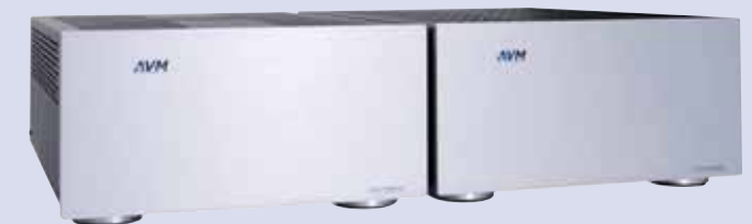
Amplificadores AVM M3ng