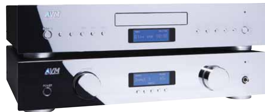
Amplificador Reprodutor CD, AVM Evolution CD3ng/A3ng

Diseñado, desarrollado y fabricado en Alemania