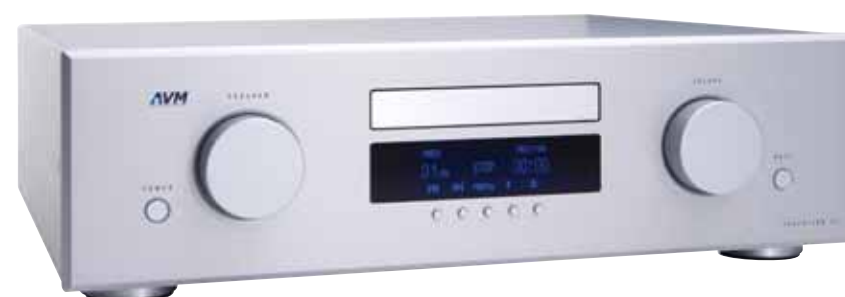
Reproductor de CD AVM Evolution C5

Diseñado, desarrollado y fabricado en Alemania