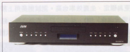
▲簡約的面板，全黑機身加上水晶藍液晶顯示屏，份外搶眼。